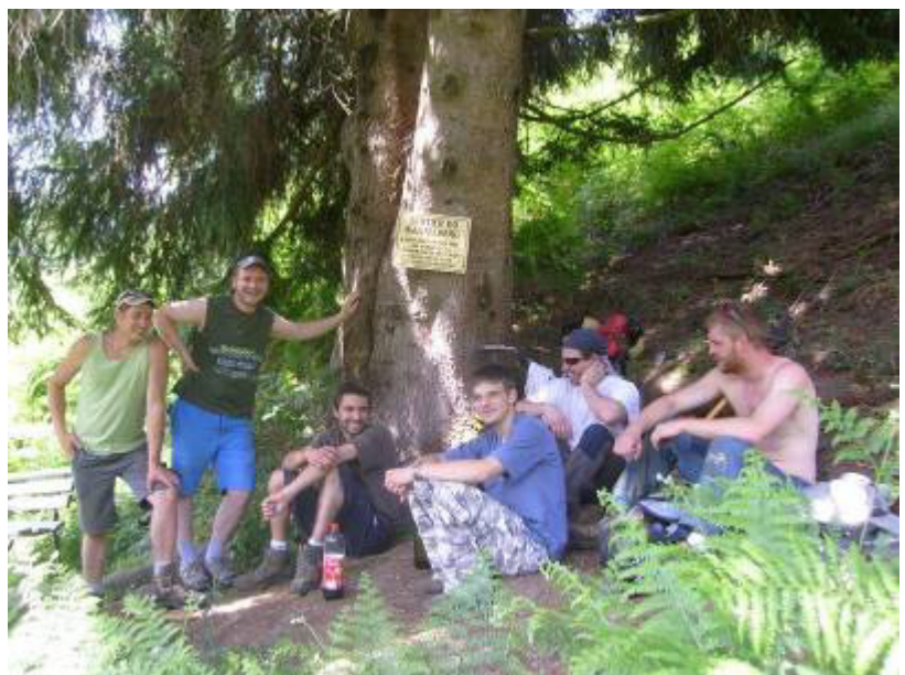
Au départ du sentier du Kastelberg