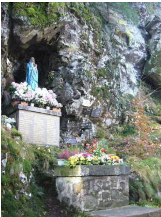
La stèle érigée en l'honneur des enfants de Mittlach morts au combat