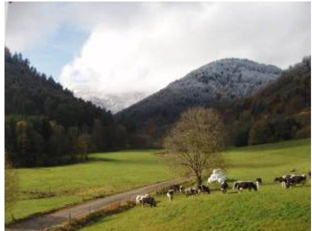
Mittlach aujourd'hui, mais demain ?