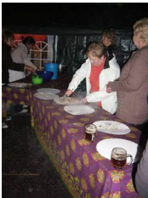
Tartes flambées à volonté