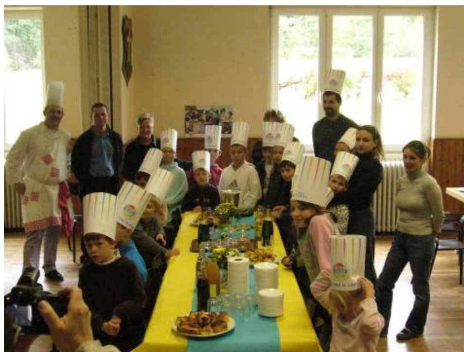
La photo de groupe