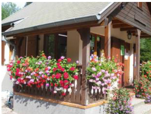
Le chalet d'accueil

Nous les remercions, ainsi que toutes les personnes qui se sont investies pour la bonne marche du camping et sa beauté, puisque - une fois de plus - le camping a été récompensé par le Prix d'excellence dans le cadre du concours « Accueillir et Fleurir ».