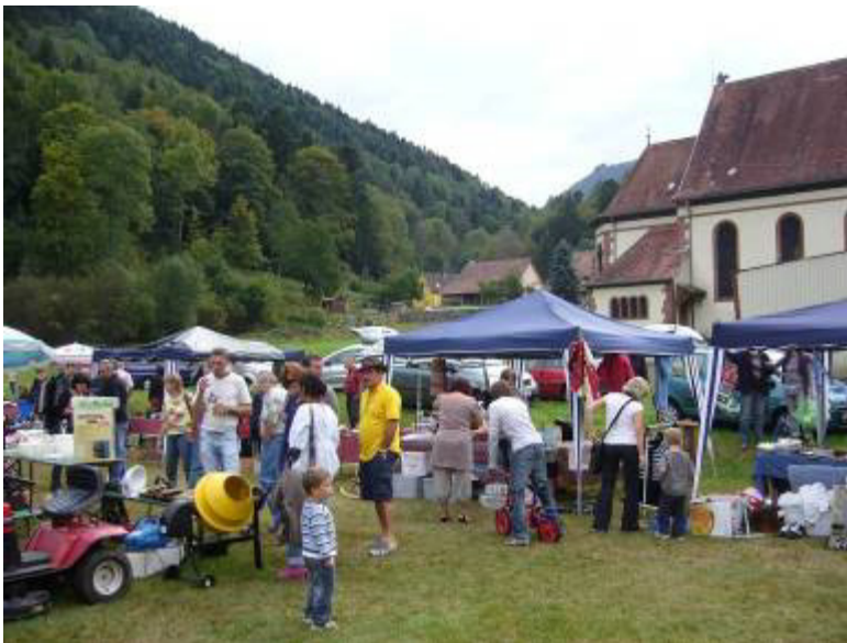
Le marché aux puces de Mittlach, dans son cadre de verdure

Les organisateurs de la manifestation ont constaté une bonne participation du public et ont été satisfaits de la bonne fréquentation des stands de boissons et de petite restauration, et rendez-vous est d'ores et déjà pris pour l'année prochaine, pour une nouvelle édition.