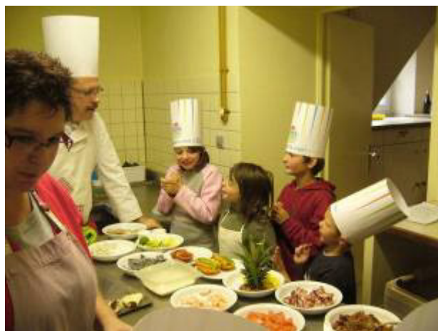
On s'active en cuisine