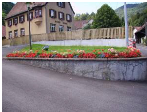
Un aperçu du fleurissement 2009 de la commune