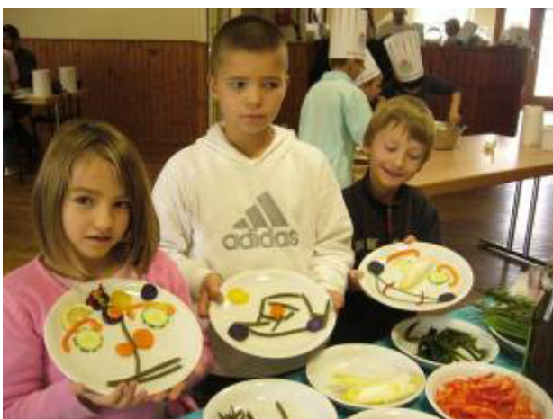
La décoration sur assiette – Bravo aux jeunes créateurs