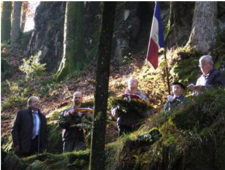
Le dépôt de gerbe à la Grotte de Lourdes