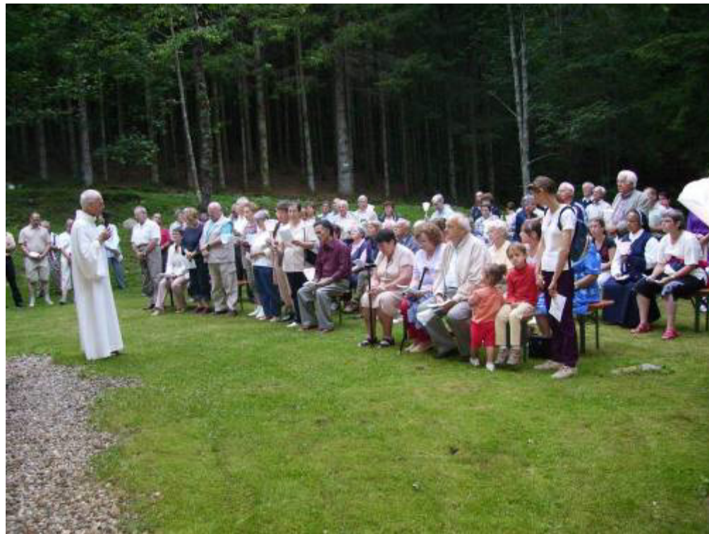
Devant la chapelle du Kolben