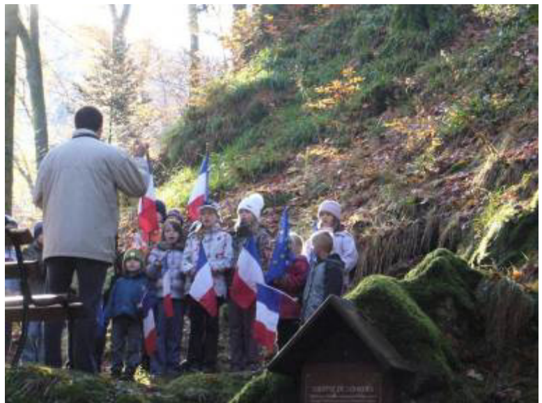
Les enfants de l'école interprètent la Marseillaise