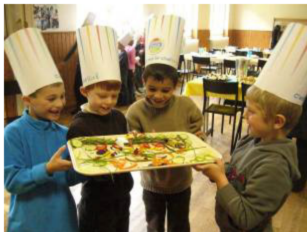
Des garçons pleins d'imagination