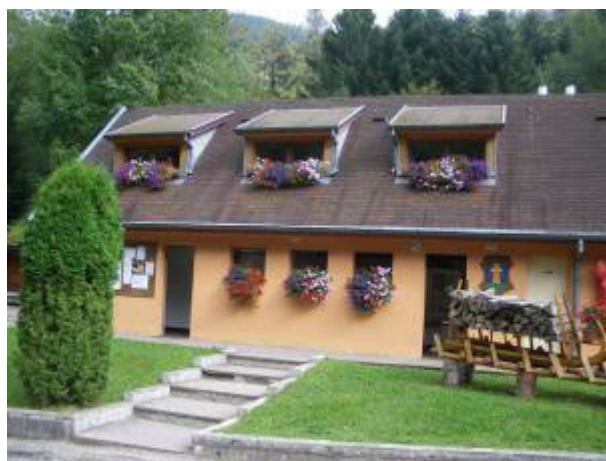
Le bloc sanitaire