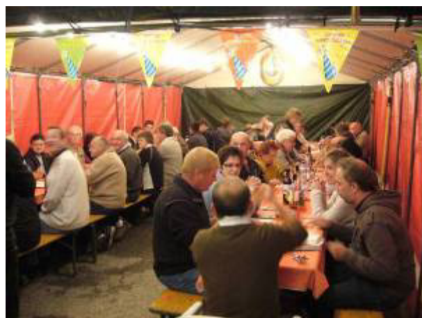
Bon appétit !