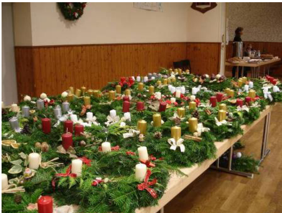
A l'ouverture du marché, les couronnes trônent majestueusement sur les tables

Tous avaient été élaborés avec passion par les parents d'élèves de la classe unique et ont fait le bonheur des acheteurs venus chercher l'objet rare et unique.