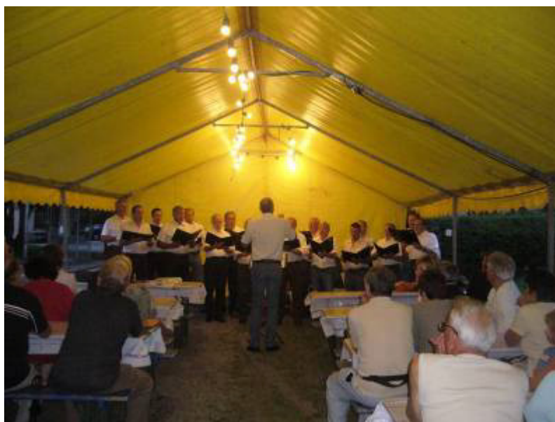
Très belle prestation de la chorale Vogesia

La soirée s'est achevée dans une excellente ambiance, avec une très bonne participation de la part des personnes présentes.