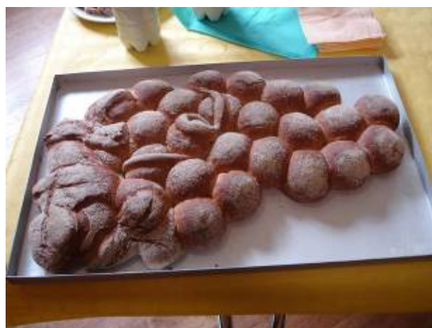
Les produits de la ferme NEFF et le pain fabriqué par le boulanger LANG Gaby