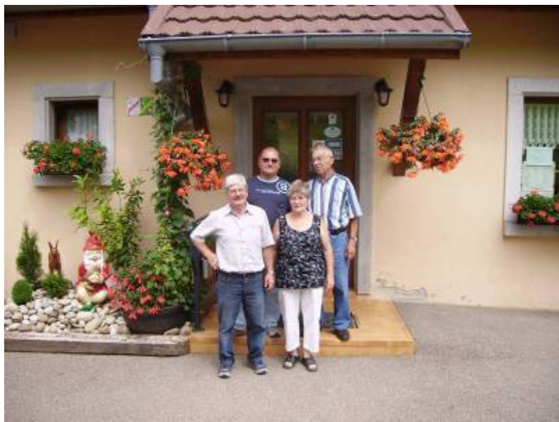
Les membres du jury 2009

Après avoir parcouru les rues du village et le Schnepfenried pour y noter l'embellissement des demeures et fermes-auberges, ils ont profité du beau temps pour déjeuner à la ferme-auberge DEYBACH avant de redescendre au village, leur travail accompli.