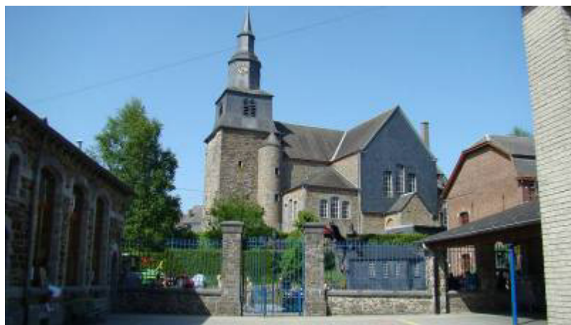
Une vue de l'Eglise de Gedinne