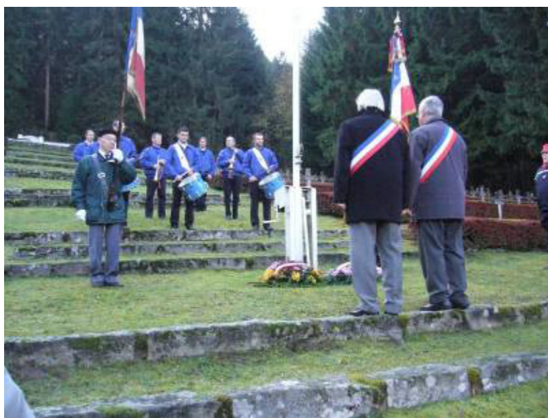
Au cimetière militaire du Chêne Millet

Les membres de la section locale de l'UNC ont ensuite partagé le déjeuner avec le maire de la commune et une partie des membres de la section UNC de Munster, à l'hôtel-restaurant Valneige.