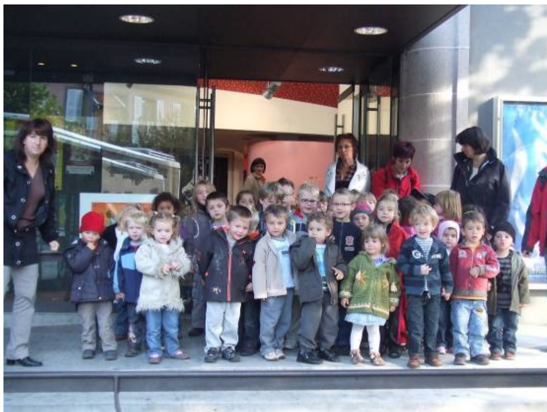
Devant la salle Saint-Grégoire, les 2 classes de maternelle