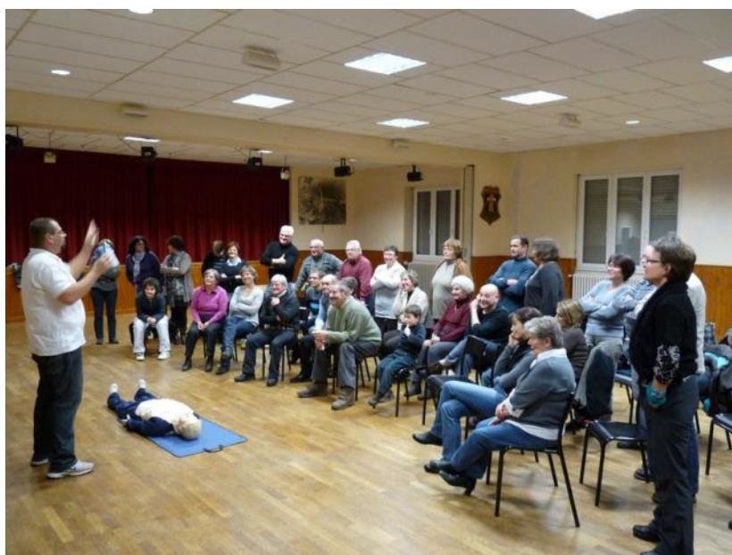
Les explications du formateur