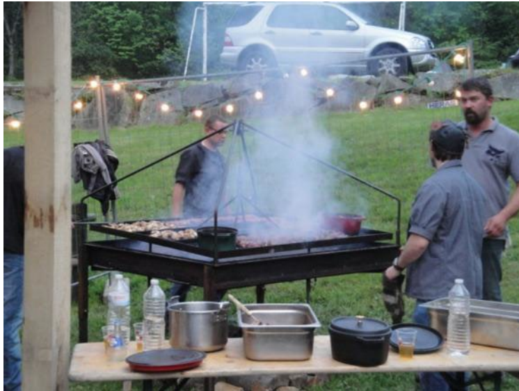
Les grillades se préparent

Non loin de là, à Mittlach, une belle fête était organisée dans ce cadre-là, et pour la deuxième fois par les membres de l'association des Jonquilles. A partir de 18 heures commençait une longue soirée, durant laquelle les accompagnateurs et badauds ont pris beaucoup de plaisir autour d'un feu de camp, ou encore en dansant au son des clarines. Ils ont évidemment pu déguster quelques grillades ou produits de la Vallée et découvrir les gestes et traditions des « Malker » (marcaires).