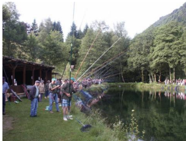
L'étang encerclé par les pêcheurs