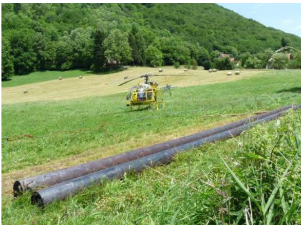
Au sol, de longs poteaux....

Grâce à cette opération, et même si elle est rare, la ferme du Kastelberg a enfin retrouvé son autonomie.