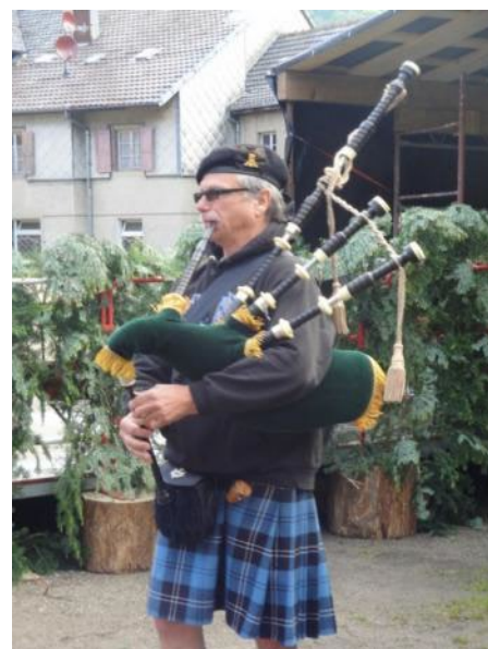
Un accompagnateur insolite !