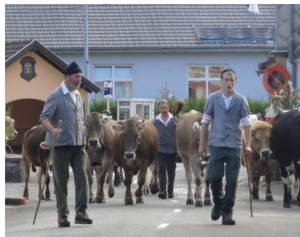
Le troupeau en route pour les verts alpages....