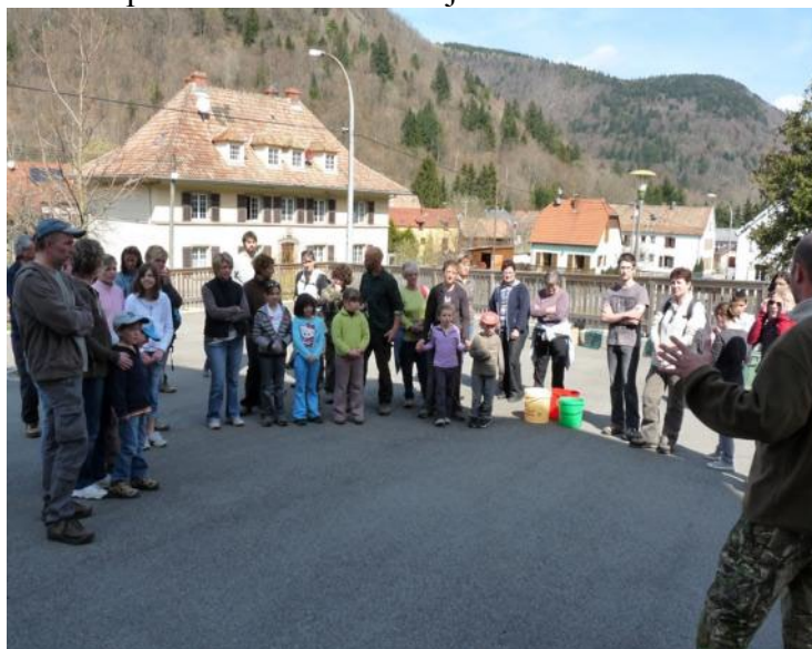
L'accueil des participants

Un grand travail a été réalisé, au vu des nombreux sacs de débris remplis par l'ensemble des participants. Après ces actions, tous se sont retrouvés au square, où les enfants de l'école ont interprété des chants, pour le plus grand plaisir des spectateurs. Puis la commune de Mittlach a invité les bénévoles à une petite collation, servie dans la salle de l'ancienne école. Un grand merci à toutes les personnes présentes lors de cette journée.