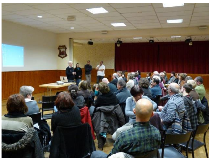
L'accueil du maire

Pour rappel, le défibrillateur est installé sur la façade avant de l'atelier municipal et est relié directement au Samu.