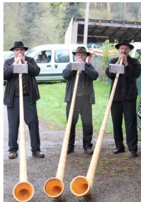
Les orchestres.... à l'abri