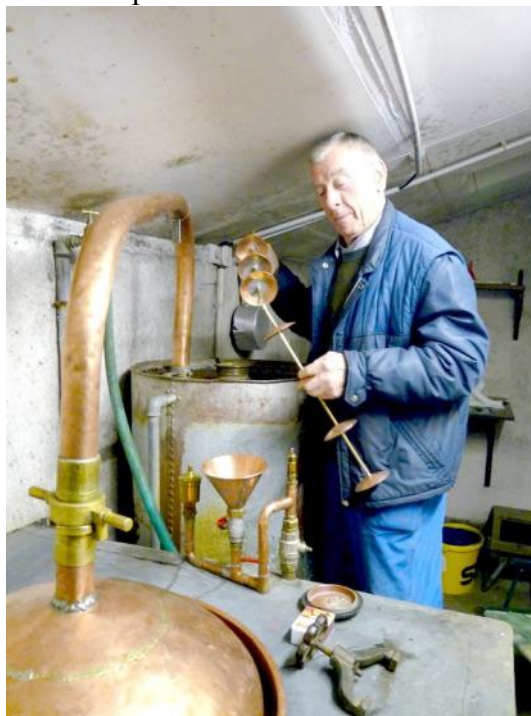
Dans la distillerie communale

Conseiller municipal de 1971 à 1995, il est depuis 1971, responsable de l'alambic communal. Rendez-vous a été pris avec lui dans ces locaux dont il connaît le matériel par cœur, et il se plait à nous informer du déroulement des opérations de distillation.