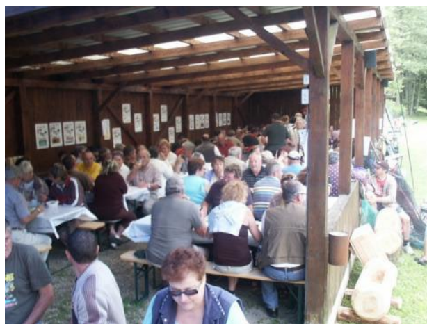
Apéritif et repas, dans une ambiance des plus chaleureuse