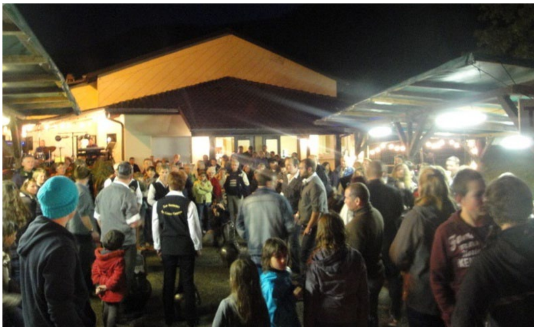
La fête bat son plein !