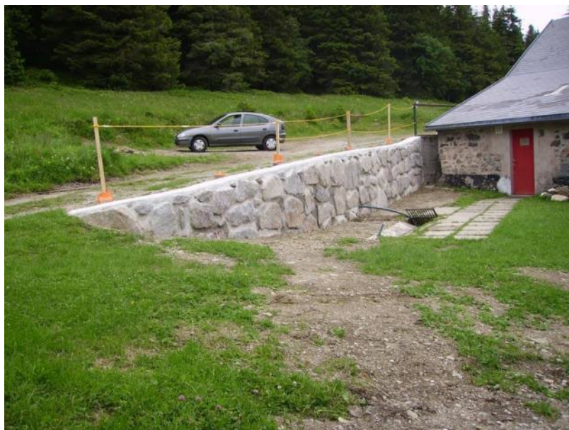
Le mur de soutènement rénové