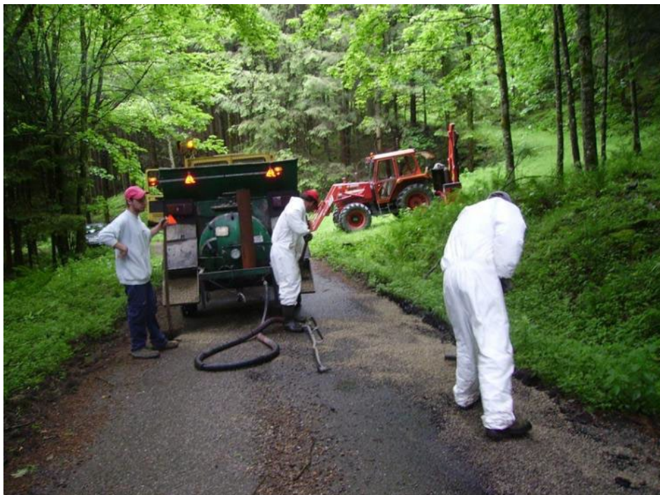
Les ouvriers à l'œuvre

La rénovation de l'ensemble de la voirie endommagée ne pouvant se faire en 4 jours, une seconde période de travaux de point à temps est prévue en septembre prochain.