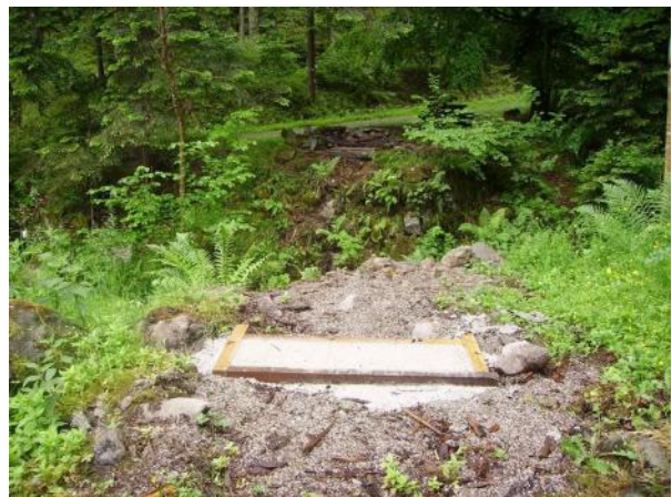
Les traces de l'ancien pont et les bases du nouveau