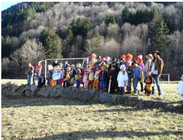
La troupe carnavalesque joliment déguisée

En cours de chemin, grimés, déguisés, et à grand renfort de confettis et serpentins, ils ont quémanté beignets, bugnes et autres friandises auprès des habitants. Douceurs qu'ils ont ensuite dégustées, accompagnées d'un bon chocolat chaud servi par les organisateurs, et ce dans la salle des fêtes du village.