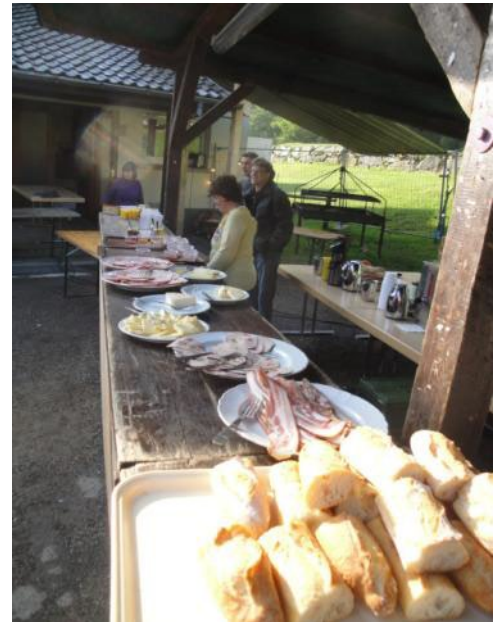
Les bons produits de chez nous