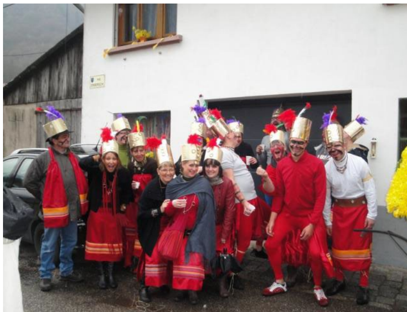
Participation à la fête des Jonquilles

Le Président remercie tous les membres présents pour leur confiance avant de passer à la mise à jour des cotisations et au verre de l'amitié.