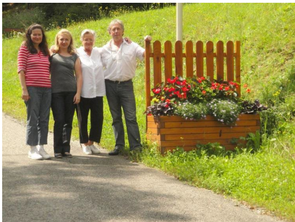
Le jury 2011

60 personnes ont été récompensées par des diplômes et bons d'achats, et, comme il se doit, cette sympathique soirée a été clôturée par le vin d'honneur offert par la Commune.