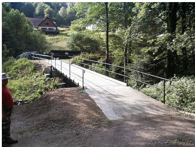
Le pont menant à l'étang, après réfection

Après clôture de l'assemblée, le président convie tous les membres à se retrouver autour du verre de l'amitié.