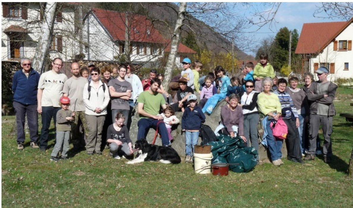
Les bénévoles au square