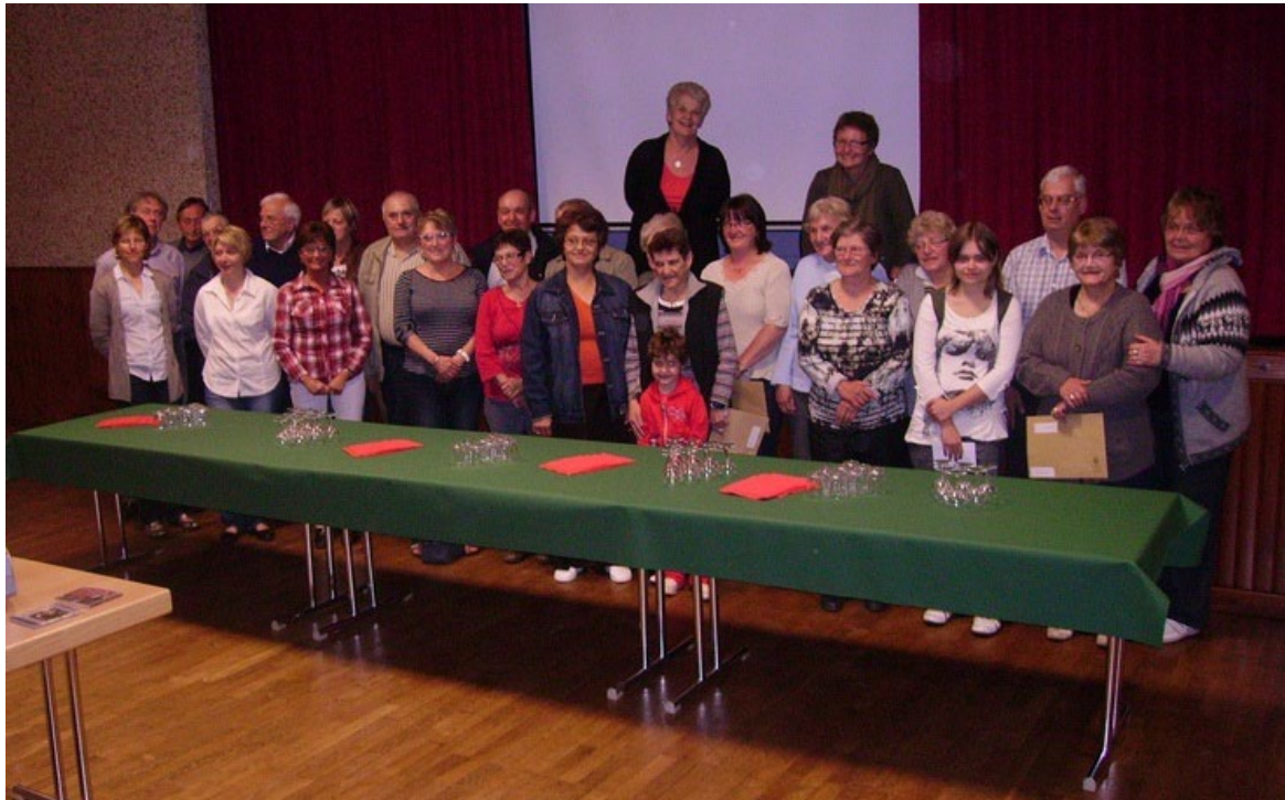
Les lauréats du concours

Pour ce 21 ème concours, le total des bons d'achat s'élève à 1 288 €, et un panier garni a été remis aux personnes qui ont arrosé les fleurs mises en place par la commune.