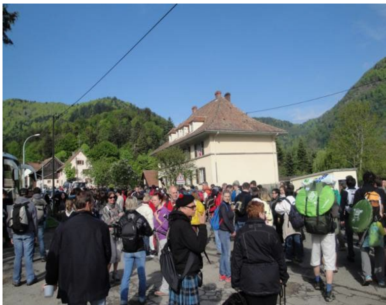
La foule prête pour la longue marche....

Tôt le lendemain, après un bon petit déjeuner pris sur place, troupeau, accompagnateurs et randonneurs ont repris la route des sommets, pour arriver en fin d'après-midi à la ferme-auberge du Treh, lieu de pacquage estival.