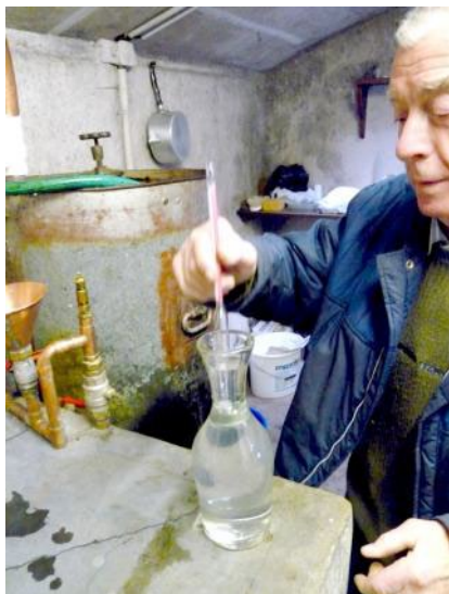
La mesure du degré d'alcool