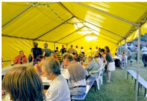
Une belle soirée de détente et de rencontre

Vous trouverez encore les comptes-rendus des assemblées générales de nos associations et le détail de leurs animations dans les pages qui leurs sont consacrées.