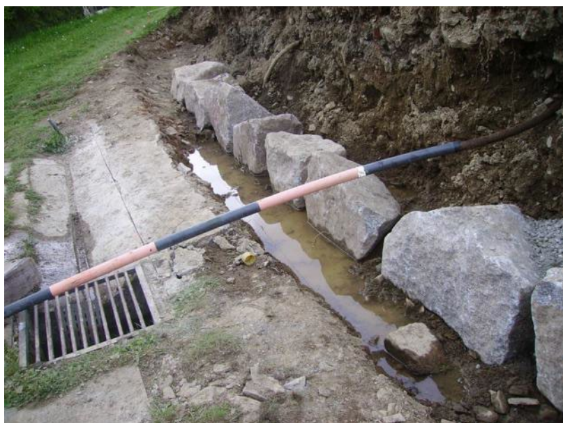
L'ancien mur, fragilisé par des infiltrations d'eau

Début juin l'entreprise Alain BAUMGART a entrepris les travaux, démoli soigneusement l'ancien mur pour refaire de nouvelles fondations et ériger une nouvelle muraille.