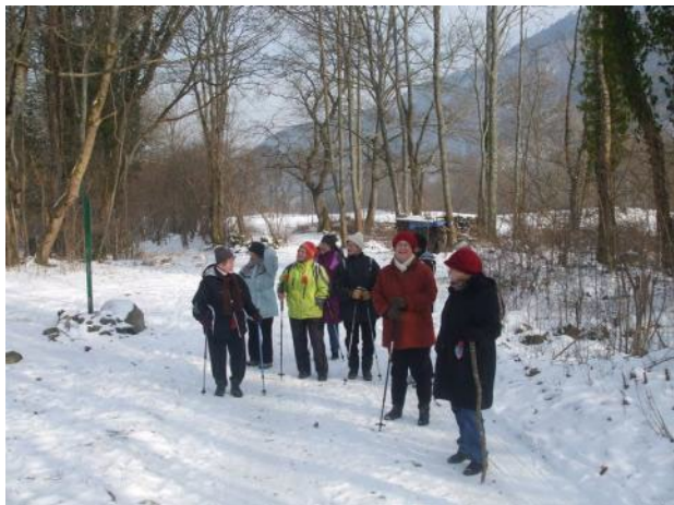
Une belle promenade en forêt

Le repas de fin de saison a eu lieu au restaurant Valneige, il a été l'occasion pour tous de passer une très belle journée et de faire des projets pour la saison à venir.