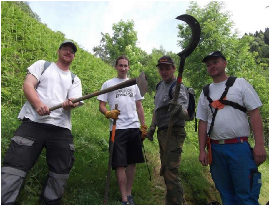
Après l'effort, le réconfort.....

L'association des Jonquilles est prête à accueillir toute personne de bonne volonté intéressée par cette activité annuelle.