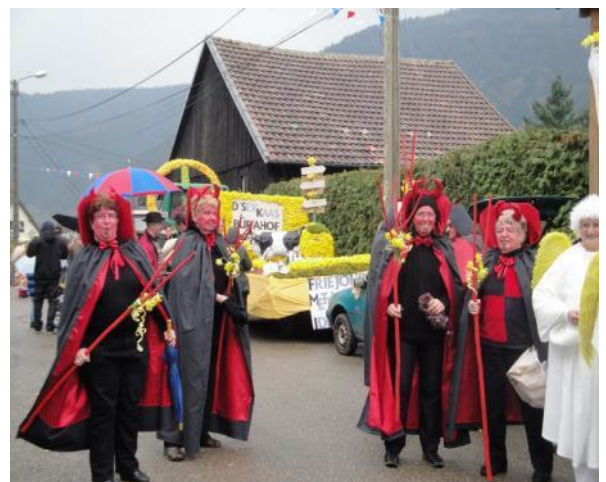
Ange ou démon ?