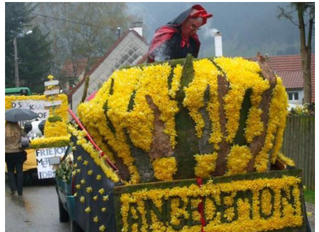
Participation à la fête des jonquilles