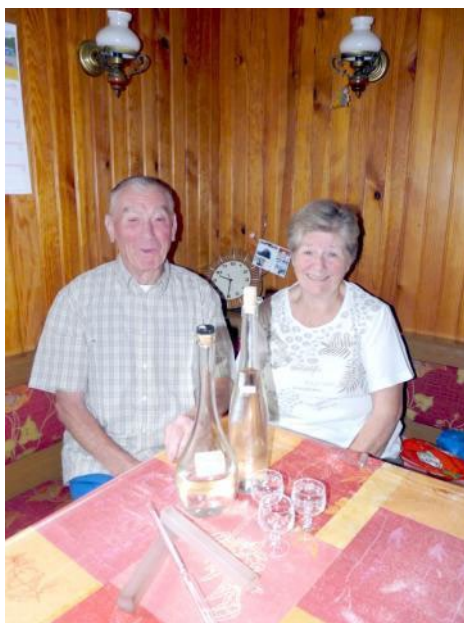
Et, pour vous faire plaisir, une petite dégustation ?