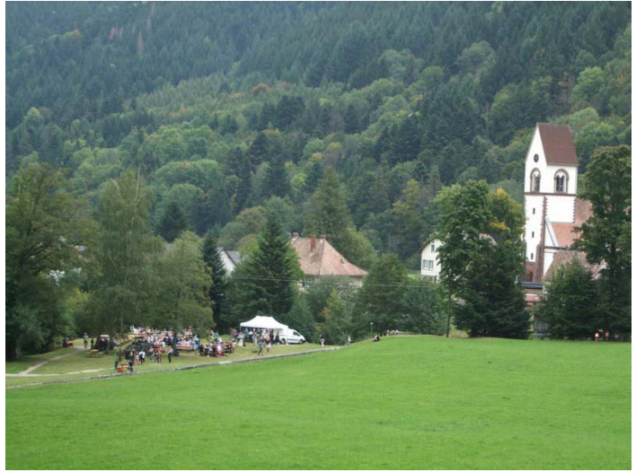
la Terrine Campagnarde, pickles et noisettes, et son Riesling, ont pu être dégustés au square de Mittlach,