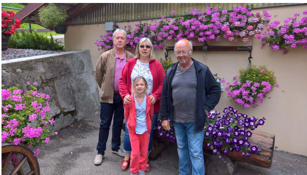
Les membres du jury 2017