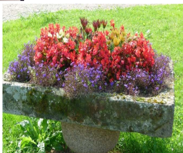
Quelques belles réalisations de cette édition 2017