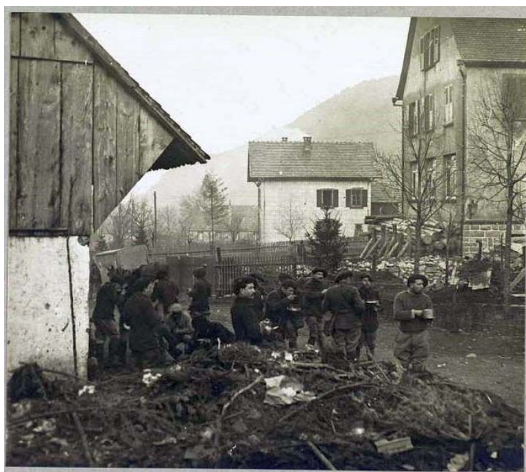
Les chasseurs alpins déjeunant sous la grange devant l'Ambulance Alpine