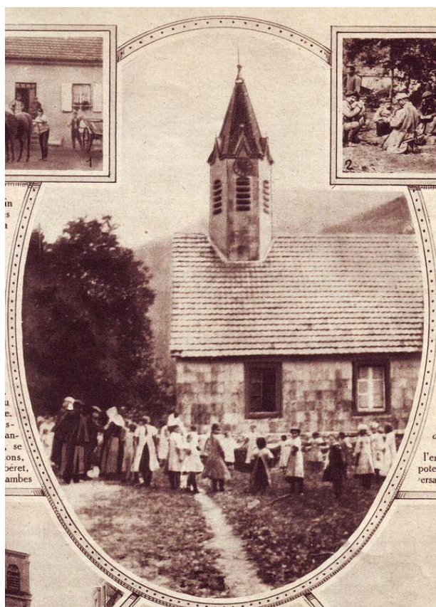
Le groupe de jeunes filles, rassemblé devant le cercle catholique

C'est l'instant du départ. Nous faisons nos adieux au cher petit village...Et nous nous éloignons, pénétrés de douceur, de respect et de tendresse.