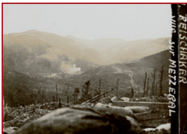
Ausblick in Richtung Metzeral vom Gipfel des Reichackerkopfs, aus den Schützengräben der 1. deutschen Linie

Hunderte von stählernen Schutzschilden, Geschossen, Bomben aller Art, Uniformen, ledernen Ausstattungsgegenständen, Stiefeln von Soldaten, von denen einige menschliche Überreste enthalten, und zerbrochenen Waffen liegen auf dem nicht wiederzuerkennenden Boden dieses von den Menschen entstellten Gipfels verstreut“.