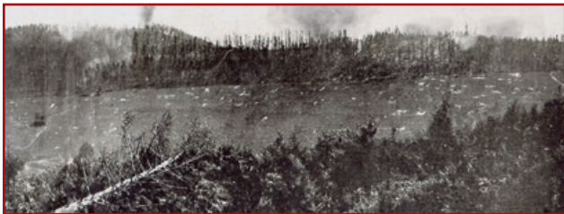
Die beiden Gipfel des Reichackerkopfs von den französischen Stellungen am Sattelkopf aus gesehen

Ab Februar 1915 greifen die Deutschen massiv auf der gesamten Front des Tals an und besetzen den Reichackerkopf. Im März und April 1915 wechselten Angriffe und Gegenangriffe einander ab. Am 6. und 7. März greifen die französischen Alpenjäger des 6. und 23. Bataillons die beiden Gipfel an und können sie unter schweren Verlusten zeitweilig einnehmen. Ab dem 20. März erobern die Deutschen schließlich die beiden von den letzten Kämpfen vollkommen erschütterten Gipfel nach einem schrecklichen Bombenangriff und mit Hilfe herangefahrener junger bayrischer Truppen zur Verstärkung zurück. Ein Wechsel von Schnellfall und Tauwetter machen die Kämpfe noch härter und unmenschlicher. Die Franzosen versuchen mit neuerlichen Angriffen im Mai, Juni und Juli 1915, die beiden Gipfel zurückzuerobern, jedoch ohne Erfolg. Dann stabilisiert sich die Frontlinie und bleibt bis zum Waffenstillstand Schauplatz sporadischer Kämpfe, die weitere zahlreiche Verwundete und Tote fordern. 1918 lösen zwei amerikanische Divisionen die französischen Truppen in diesem Bereich von trauriger Berühmtheit an der Vogesenfront ab.