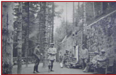
Das Hauptgebäude der Ambulance Alpine 2/75 im Jahre 1916. (Dokument aus dem Val de Grâce Museum in Paris)

Auf einem kleinen Weg gelangen Sie zur Basis dieser Plattform 19 . Es handelt sich hier um das Hauptgebäude der Gebirgs-Unfallstation 2/75, die im Camp Nicolas stationiert war. In diesem beeindruckenden Gebäude, das ursprünglich 45 Meter lang war, befanden sich 10 Operationssäle. Ein Wasserspeicher aus Beton ist ebenfalls unter diesem ganz aus Granit gebauten Komplex sichtbar. In der Umgebung standen weitere befestigte Unterstände, verdeckt durch den dichten Tannenwald. Die meisten von ihnen sind nach dem Krieg zerstört worden. Sie befinden sich hier in einem der bedeutendsten französischen Lager der Region, dem Camp Nicolas, benannt nach dem Kommandanten Nicolas, Chef des 24. Alpenjägerbataillons, der am 21. Juli 1915 am Reichackerkopf getötet wurde.