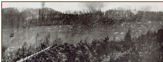
Vue d'ensemble des deux sommets du Reichackerkopf prise depuis les positions françaises du Sattelkopf en 1915

Deux possibilités d'accès et de départ s'offrent à vous :