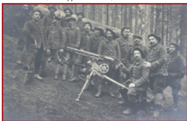
Groupe de chasseurs alpins mitrailleurs dans le bois du Sattel en 1915

Après plus de 2 kilomètres, vous trouverez sur votre gauche, un indicateur qui vous guidera sur environ 200 mètres vers l'emplacement d'un ancien abri de mitrailleurs 21 . Ces hommes avaient, pendant leurs temps de repos, réalisé une véritable œuvre d'art. Ils avaient inscrit dans un corps de chasse le numéro de leur compagnie en sculptant le tout dans un blason de ciment. Aujourd'hui rares, ce type d'abris, construits en rondins de bois ou en pierre, étaient, fréquents, à cette époque, sur les pentes du Sattelkopf en raison de la proximité de la ligne de front. L'artillerie allemande avait beaucoup de difficultés à les repérer car la forêt assurait ici une couverture et un camouflage efficace.