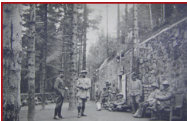
The main building of the Ambulance Alpine 2/75, 1916.

A small path lets you access the base of this platform 19 . It is actually the main building of the 2/75 Alpine Ambulance, established in the Nicolas Camp. This impressive building, initially over 45 metres long, was used as a corps for about ten medical care and surgical units. A concrete water reservoir is also visible under this ensemble all built in granite.