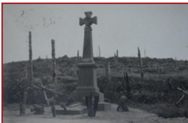
The «De Guardia monument» at the Col du Sattel, 1921.

The first was built in memory of the second lieutenant Jean de Guardia killed here at the age of 20.