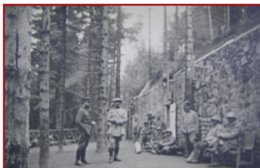
Le bâtiment principal de l'Ambulance alpine 2/75 en 1916

Un petit sentier vous permettra d'accéder à la base de cette plateforme 19 . Il s'agit là du bâtiment principal de l'Ambulance Alpine 2/75 implantée dans le camp Nicolas. Ce bâtiment impressionnant, long de plus de 45 mètres à l'origine, servait de corps à une dizaine de salles de soins et d'opérations chirurgicales. Un réservoir d'eau en béton est également