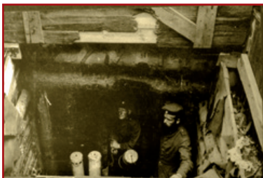
German heavy mortar in shooting position at Reichackerkopf

This structure shows the narrow living quarters for the soldiers as well as the depth of the underground installations. The mortar placed here in 1915 was intended to bombard the Sattel Pass, an unavoidable pathway for the French foot soldiers. During the war, this rather archaic contraption was replaced by the Minenwerfer (mine launcher) very ahead of its time thanks to its technological innovations and its manoeuvrability.