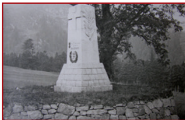
Das durch die Stadt Nice gestiftete Denkmal, im dem Zustand von 1921

An diesem Frontabschnitt, einem wahren im Wald versteckten menschlichen Bienenstock, befanden sich mehrere tausend Soldaten. Sie fanden hier relative Ruhe, die Pflege, der sie bedurften und eine Verschnaufpause, die dem Ausruhen oder dem Reparieren ihrer Ausrüstung gewidmet war. Kehren Sie nach dem Besuch der Unfallstation, die zu der Zeit ein Modell für alle französischen Sanitäreinheiten war, um bis zur letzten Kreuzung. Biegen Sie dann nach rechts auf den Weg ab, der nach ca. 300 Metern zu einem französischen Betonunterstand führt. In mehreren mündlichen Überlieferungen wurde uns bescheinigt, dass dieses Bauwerk in den Jahren 1915 bis 1918 als Unterschlupf für mehrere französische Generäle gedient hat, darunter General Armeau de Pouydraguin.