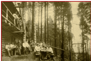
Image d'ambiance auprès d'un câble transbordeur. De nombreux hommes étaient affairés auprès de ces stations par lesquelles transitait une grande partie des matériaux nécessaires à la vie en campagne

Le chemin va lentement tourner vers la droite pour rejoindre le Moenchberg qui domine directement la ville de Munster. A l'extérieur de ce virage, sur votre gauche, vous allez apercevoir une grande plateforme de béton. Il s'agit en fait de la dalle de couverture d'une station d'arrivée d'un câble transbordeur 11 , installée ici par les Allemands pour faciliter l'acheminement de matériels lourds depuis le chemin inférieur et ainsi s'affranchir de la