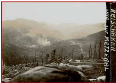
Paysage du sommet du Reichacker, vu depuis les tranchées de 1 ères lignes allemandes en direction de Metzeral

éparpillées. Des centaines de boucliers de tranchées en acier, d'obus, de bombes en tout genre, d'uniformes, d'équipements de cuir, de bottes de soldats dont certaines contenant des restes humains, d'armes brisées, jonchent le sol méconnaissable de ce sommet défiguré par les hommes ».