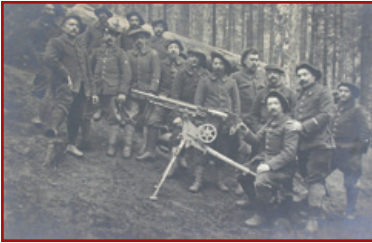
Group of alpine soldiers in the Sattel woods, 1915.

After over 2 kilometres, you will find an indicator on your left guiding you over about 200 metres towards the location of an ancient machine-gunner shelter 21. During their free time these men created a real work of art. They had inscribed their company number within a firing building, sculpting the whole within a cement coat of arms. Today this sort of shelter built using