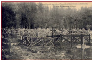
Postcard of the cemetery of Germania, published after the war for the numerous visitors coming from all the regions of France.

You will then reach the forest track which you will follow for about 800 metres. There are two picnic tables along this track. 500 metres further along you will find an embedded touch-screen table 17 bis on the right side of the track, which helps you discover and touch some familiar elements of these two enemies: rifle bullets, shrapnel or grenades, barbed wire... Less than 100 metres after the last table, you will come across one of the largest military cemeteries 18 in this area. Created here as of 1915, following the first massacres during the spring of this terrible year, this place, called Germanien or Germania, was the first burial site for several hundreds of French and American soldiers who remained there until the 1930's under their white wooden crosses.