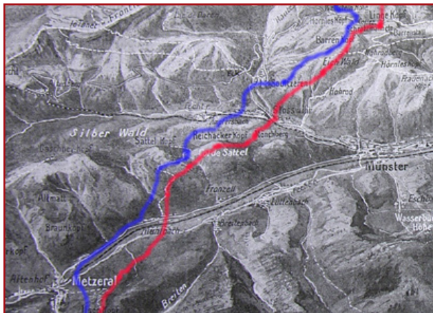
Drawing of the front from July 1915 to November 11, 1918

You have two possibilities to access and leave: