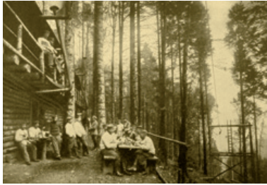
Ambience image with a ferry cable. Many men were busy with these stations, through which much of the material needed for country life passed.

The track will slowly turn towards the right to reach the Moenchberg which directly overlooks the city of Munster. Outside the bend on your left you will see a large concrete platform. It is in fact the concrete covering for an end station of an air-ferry 11 , installed here by the Germans to facilitate transporting heavy materials from the lower track and therefore avoiding the steepness of the slopes in this sector. You can access the building facade from the side to fully gauge its dimensions and inner volume. On the upper part of the facade there is a cement plate with the following inscription: "Umgebaut I Ldst. Inf. Batl. Freib XIV/I Aug. 1917" which means "Modified by the 1st Territorial Infantry Battalion of Freiburg in August 1917." Inside the building we can see the remains of the metal framework which was stripped down by scrap merchants after the war. This significantly crippled the structure of these edifices so we ask you to please be extremely careful when walking around.